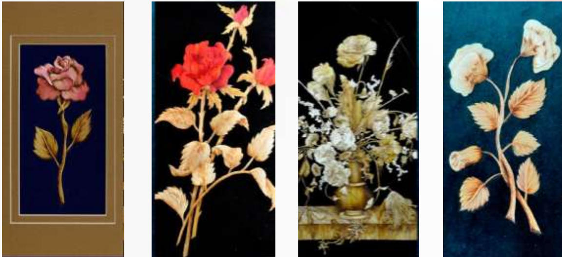
2-rasm. Somondan tayyor kompozitsiyalar namunalari

Somon bilan ishlash — bu nafaqat badiiy mehnat turi, balki o‘quvchilarning ekologik tafakkurini va milliy qadriyatlarga bo‘lgan hurmatini shakllantiruvchi samarali pedagogik vositadir. Boshlang‘ich sinflarda o‘quvchilarni somondan kompozitsiya bajarishga o‘rgatish mavzusi yuzasidan quyidagi xulosalarga kelish mumkin: