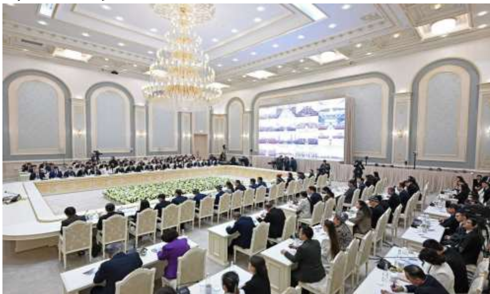
1-rasm. Shavkat Mirziyoyevning yoshlar bilan ochiq muloqoti. 2026-yil 24-fevral.

IT sohasining rivojlanishi nafaqat yoshlar bandligini ta'minlaydi, balki mamlakat iqtisodiyotiga ham katta hissa qo'shadi. Dasturiy mahsulotlar eksporti valyuta tushumini oshiradi, yangi ish o'rinlari yaratiladi va innovatsion muhit shakllanadi. Raqamlashtirish jarayonlari davlat boshqaruvi samaradorligini oshirib, aholiga ko'rsatilayotgan xizmatlar sifatini yaxshilamoqda.