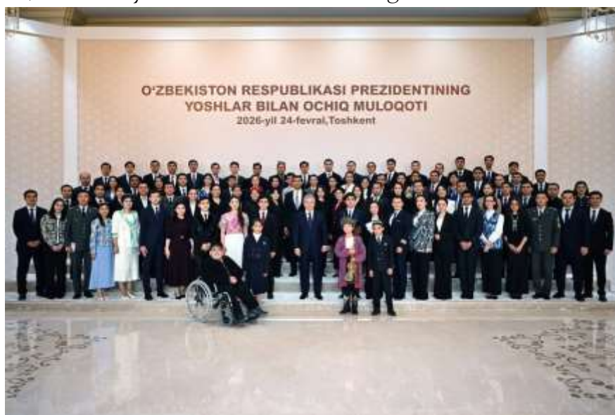
2-rasm. Shavkat Mirziyoyevning yoshlar bilan uchrashuvidan lavha.

Shu bilan birga, IT sohasida ayrim muammolar ham mavjud. Malakali kadrlar yetishmasligi, ingliz tilini bilish darajasining pastligi va amaliy tajriba kamligi sohaning jadal rivojlanishiga to‘sqinlik qilishi mumkin. Shuning uchun yoshlar o‘z ustida doimiy ishlashi, zamonaviy bilim va ko‘nikmalarni egallashi zarur.