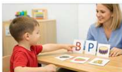
Rasm 2. "Qaysi tovush eshitildi?" o'yini: bola eshitgan tovushga mos kartochkani tanlash jarayoni.