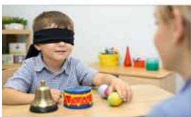
Rasm 3. "Tovushli predmetlar" o'yini: bola kózi yumilgan holda tovush chiqarayotgan predmetni aniqlash jarayoni.