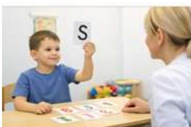
Rasm 1. "Tovushni top" o'yini: bola eshitgan tovushga mos kartochkani ko'tarish jarayoni.

Tadqiqot natijalari shuni ko'rsatdiki, neyropsixologik o'yin usullarining tizimli qo'llanilishi alaliyali bolalarda eshituv idroki va fonematik eshituvning sezilarli darajada rivojlanishiga olib keladi. O'yin faoliyati orqali tashkil etilgan mashg'ulotlar bolalarda nutqiy jarayonlarga qiziqishni oshiradi, eshituv xotirasini mustahkamlaydi hamda nutqni idrok etish qobiliyatining rivojlanishiga ijobiy ta'sir ko'rsatadi. Natijada bolalarda nutq tovushlarini farqlash, so'z tarkibini anglash va nutqni to'g'ri talaffuz qilish ko'nikmalari bosqichma-bosqich shakllanadi.