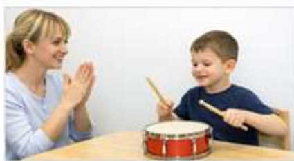
Rasm 4. "Ritmni takrorla" o'yini: bola logoped bergan ritmni baraban yordamida takrorlash jarayoni.

Shu bois neyropsixologik o'yin texnologiyalaridan foydalanish alaliyali bolalar bilan olib boriladigan logopedik korreksion ishlarning samaradorligini oshirishda muhim metodik vosita sifatida namoyon bo'ladi.